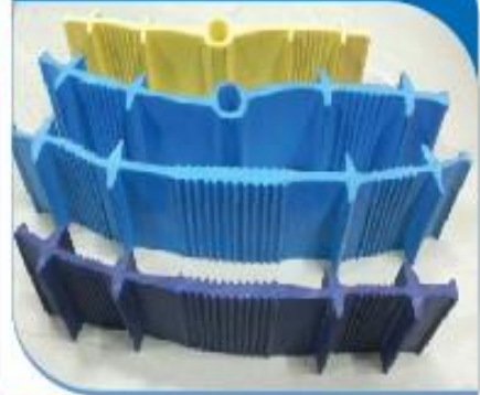
PVC Water Stopper