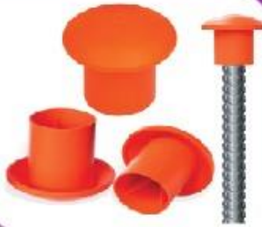
Re-Bar Safety Cap